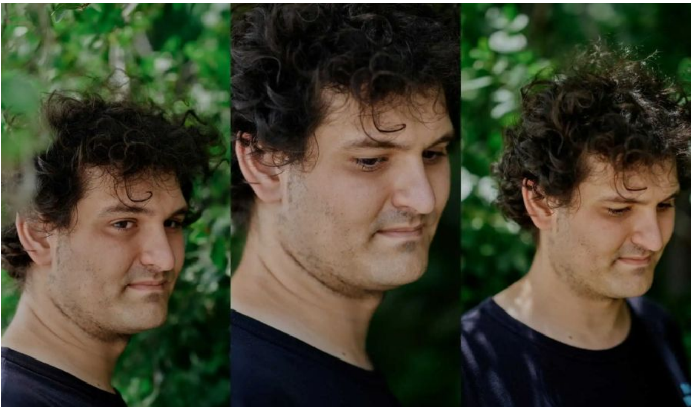
Твое лицо, когда ты за пару дней превратился из второго самого богатого человека в крипте в первого самого ненавидимого в той же категории

Для Сэма Бэнкмана-Фрида это ознаменовало практически мгновенную потерю большей части всего нажитого состояния: если еще неделю назад Bloomberg оценивал его богатство в $15,6 миллиардов, то сейчас издание уже считает, что его доли в Binance и Alameda Research можно считать ничего не стоящими. Таким образом, состояние Бэнкмана-Фрида сократилось почти в 20 раз (на 95%) всего за несколько дней.