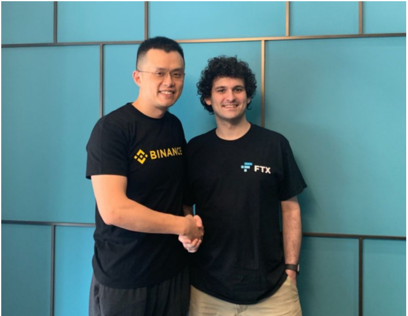
Чанпэн Чжао и Сэм Бэнкман-Фрид: когда-то они были криптокорешами...

Американец начинал свою карьеру в сфере традиционного трейдинга, и только потом переключился на крипту – неудивительно, что созданная им в 2019 году криптобиржа FTX стала лидером именно в области торговли разнообразными деривативами. Сэм живет немножко как рокнролла: пачками дает публичные выступления, называет в честь FTX целые стадионы, и не стесняется тратить деньги на рекламу с привлечением знаменитостей.